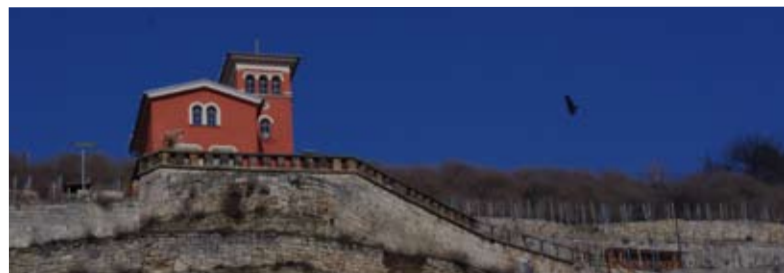
Schweigenberge bei Freyburg

Gebietstypisch zeichnen sich die Weine von Saale-Unstrut durch ein elegantes feingliedriges und fruchtiges Bukett mit mineralischen Nuancen aus. Muschelkalkverwitterungsboden, aber auch Buntsandstein, Lößlehm und Kupferschiefer sind zu finden. In den Flusstälern sorgen „Wärmeinseln“ für ein besonderes mildes Mikroklima. Die Sonne scheint etwa 1.600 Stunden im Jahr. Mit rund 500 mm Niederschlag jährlich zählt die Weinbauregion zu den niederschlagsärmsten in Deutschland. Die durchschnittlichen Erträge liegen bei rund 50hl/a.*