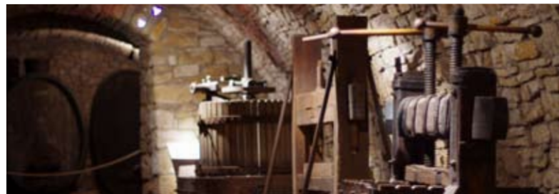
Keltergeräte im Weinkeller Burg Neuenburg, Freyburg

1999 wurden 1000 Jahre Weinbau an Saale und Unstrut gefeiert. Die Schenkungsurkunde Kaiser Otto III. aus dem Jahr 998 erwähnt neben den sieben Dörfern für das Kloster Memleben ausdrücklich die dort befindlichen ausgedehnten Weinländereien. Die Rebkultur, vermutlich von den Franken nach der Zerschlagung des Thüringer Reiches im frühen Mittelalter nach Thüringen importiert, wurde durch Geistlichkeit und Adel gefördert. Das Weinbaugebiet war mit vermutlich 10.000 Hektar Rebfläche, der Historiker Dieter Coburger greift 1995 weit aus und vermutet sogar 60.000 Hektar zwischen Harz, Thüringer Wald, Rhön und Frankenwald, eines der größten Anbaugebiete des deutschen Mittelalters. Mit der politisch heftig vorangetriebenen Christianisierung und dem einhergehenden Klosterbau, erfuhr auch der Weinanbau seinen Wirtschaftsaufschwung. Coburger schreibt in seiner 1993 erschienenen Abhandlung „Tausend Jahre mit Karst und Hippe“: „Wein blieb über Jahrhunderte das Hauptge-