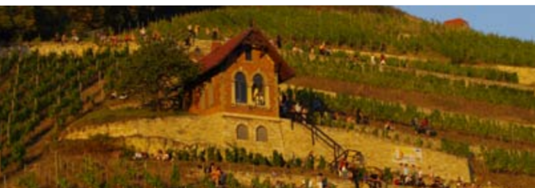
Jährliches Weinfest in Freyburg

tränk, hinter dem Met, Bier, Brand- und Obstwein weit zurückstanden. Kaffee, Tee, Kakao und Limonaden waren noch unbekannt. Das Wasser war während der vielen Seuchen oft unrein. Der edle Saft der Rebe wurde von Hoch und Niedrig gleich gern getrunken. Der Landwein war im Volk alltägliches Getränk.“