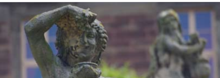
Bacchusstatue im Schloßpark Burgscheidungen

Weit über 50 Rebsorten sind hier heimisch, die vorwiegend trocken angebaut werden. Angeführt wird die Weißweinliste vom feimwürzigen Müller Thurgau, gefolgt vom feinfruchtigen Weißburgunder und vom erdigen Silvaner. Aber auch der spritzige Riesling, die temperamentvollen Kerner- und Bacchusweine, der edle Grauburgunder oder der rare Gutedel finden hier ins Glas. Schon jeder vierte Liter Wein ist rot! Sie überzeugen durch Kraft und Frucht wie der vollmundige und schmelzige Blaue Zweigelt, der samtige Spätburgunder, der feurige Dornfelder oder der fruchtige Portugieser.*